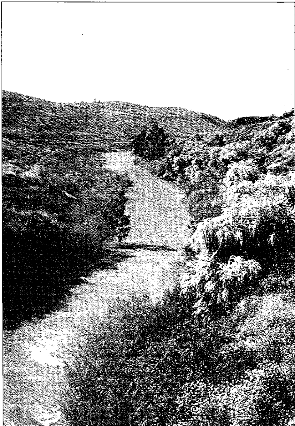
Râul Iordan nu este impresionant prin mărimea sa, dar a devenit cel mai important râu din lume din pricina evenimentelor biblice cu care este asociat. În fotografie se poate observa unul din nenumăratele coturi ale acestui curs de apă de la Marea Galileii până la punctul de vărsare în Marea Moartă.