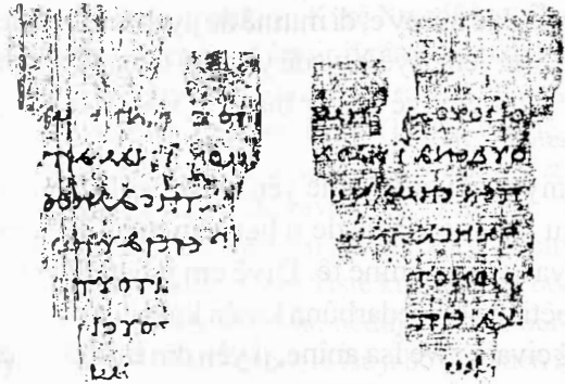
Perçeyekî Rylands ê papiirûsê yê aîdê salên 130-140 ên P.Z. ku weke nusxeyî herî Kevin a Încilê tê zanîn. Pirtûkxaneyî John Rylands a Zanîngeha Manchesterê.