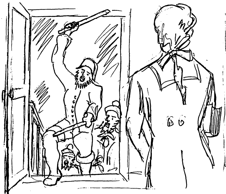
Die Tür sprang auf und eine Schar wilder Seeleute polterte herein.

Was ihre Herzen ihm gewonnen hatte? Sein Glaubensmut und seine Unerschrockenheit. Er war nach Falmouth gekommen und hatte eine Methodistin, die krank lag, besucht. Plötzlich dröhnten wuchtige Schläge durch das Haus. Ein Blick