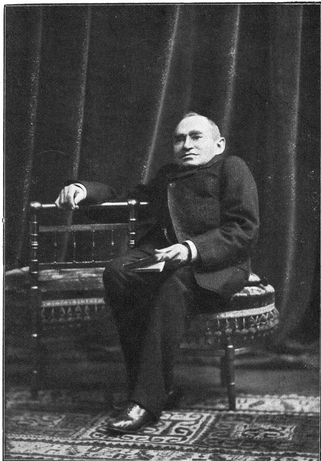
Բրիչ Օեիբաժ. †