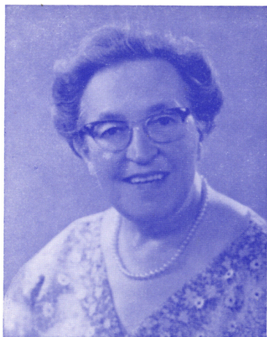
Corrie ten Boom

Corrie ten Boom ist Holländerin. Während des Krieges hat sie mit ihrer ganzen Familie und einem großen Kreis von Freunden Juden gerettet. Dafür kamen sie und ihre Angehörigen ins KZ. Sie als einzige wurde nach großer Leidenszeit gerettet. Und nun reist sie seit fast zwanzig Jahren um die Welt, um zu berichten, was sie im KZ erlebt hat: „Ein Kind Gottes kann nie zu tief fallen, immer sind unter ihm die ewigen Arme, die es tragen. — Das Licht Jesu ist stärker als die tiefste Finsternis. — Ein Ozean von Liebe Gottes steht jeden Augenblick und für jede Gelegenheit zu unserer Verfügung.“